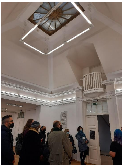
Izstādes apmeklējums Kauno Koleģija Mākslas akadēmijā