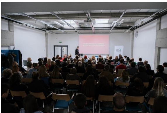
Lekciju apmeklējums International week ietvaros

Papildus tikšanās ar Kaunas kolegija pārstāvjiem esmu arī apmeklējusi Vilnius universitātes Kauņas filiāli, tiekoties ar maģistrantūras programmas Art management programmas vadītāju un vadošo pētnieci. Esam pārrunājušās iespējas mācībspēku apmaiņai, ņemot vērā ļoti līdzīgu programmas saturu abām programmām, kā arī iespējas veikt kopīgus pētījumus.