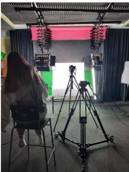
KUAS Foto darbnīca studiju darbam