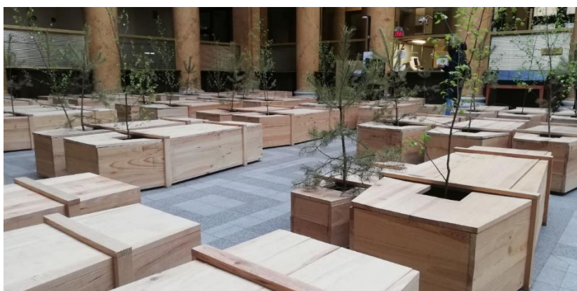
Japāņu mākslinieces JOKO ONO izstādes apmeklēšana