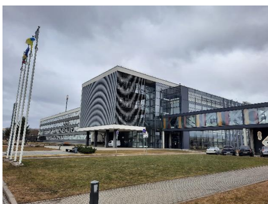
Kaunas University of Applied Sciences (KUAS) Pramonės pr. 20, Kaunas

Pielikumā foto no KUAS International Week “SUSTAINABLE APPROACH TO EDUCATION” 07.-10.03.2022.