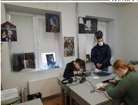
KUAS Mākslas un izglītības fakultātē (Faculty of Arts and Education) Stikla dizaina nodarbība