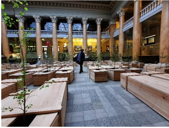
Joko Ono (Yoko Ono) izstāde, instalācija “THE LEARNING GARDEN OF FREEDOM AND EX IT” Lietuvas bankā (Bank of Lithuania Maironio g. 25, Kaunas)